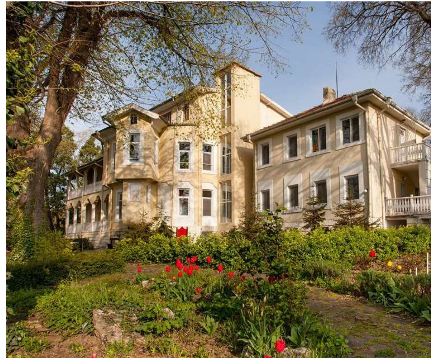
Сградата на Карин дом в Морската градина на Варна

През 2019г. Карин дом стартира своята дългогодишна мечта и обяви официално отварянето на международен архитектурен конкурс за идеен проект на новия център.